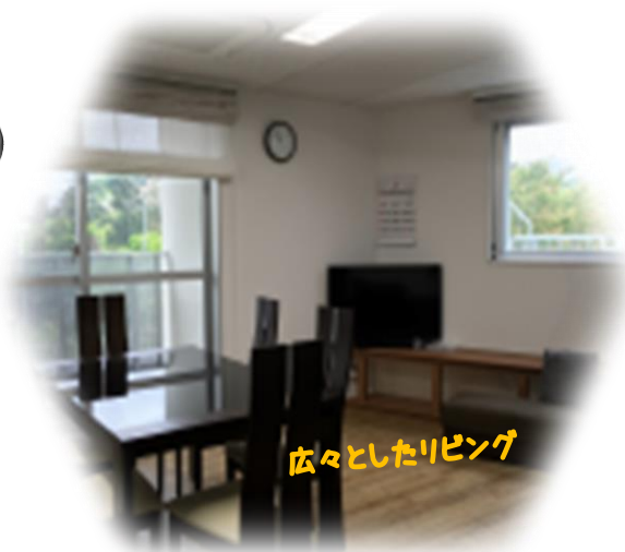
広々としたリビング

ワンルームタイプ、リビングなど設備も充実！ 独り暮らしをしてみたいけど…いきなりは少し不安… 生活の練習や就労がしてみたい！